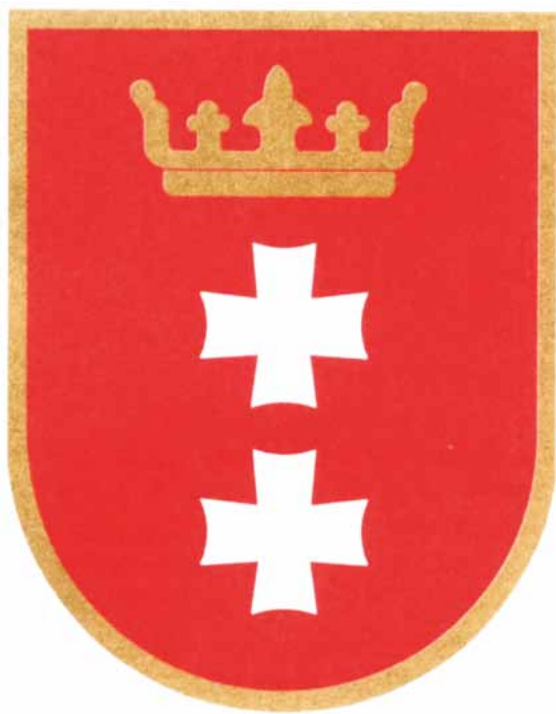
Danzigin kaupungin vaakuna