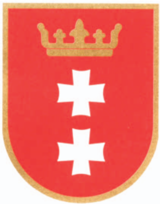
Het stadswapen van Danzig